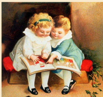
Zur Kinderträffweihnachten sind alle Kinder und ihre Eltern und

Weihnachtsgottesdienst für Kinder Kinderträffweihnachten, Sonntag, 18. Dezember um 19.00 Uhr